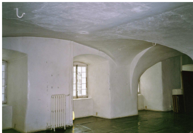
Photo cuisine de Mgr de Laval