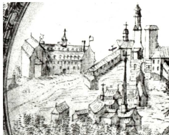
Le Petit Séminaire de 1677 à gauche cartouche de Franquelin 1688